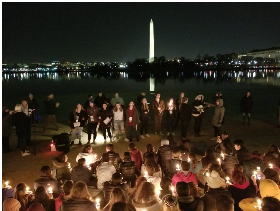
Havdalah with view of the Washington monument

Today is the 44th day that is 6 weeks and 2 days of the Omer.