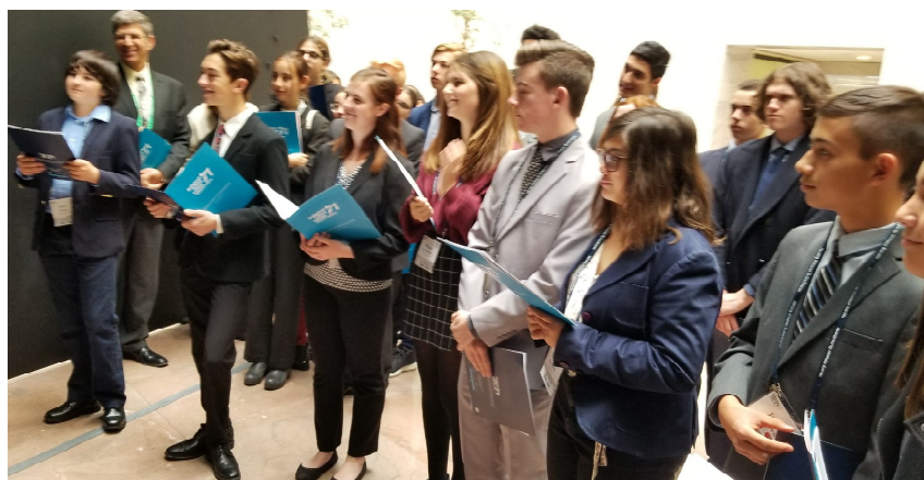
Meeting with representative of Kamala Harris at the senate

שְׁלוֹם רַב עַל יִשְׂרָאֵל עִמָּךְ תְּשִׁים לְעוֹלָם, כִּי אַתָּה הוּא מְלֶכֶךְ אֲדוֹן לְכָל הַשְּׁלוֹם. וְטוֹב בְּעֵינֶיךָ לְבָרֶךְ אֶת עַמְּךָ יִשְׂרָאֵל, בְּכָל יְת וּבְכָל שְׁעָה בְּשִׁלּוֹמֶךָ. בְּרוּךְ אַתָּה יְיָ, הַמְּבָרֵךְ אֶת עַמּוֹ יִשְׂרָאֵל בְּשְׁלוֹם.