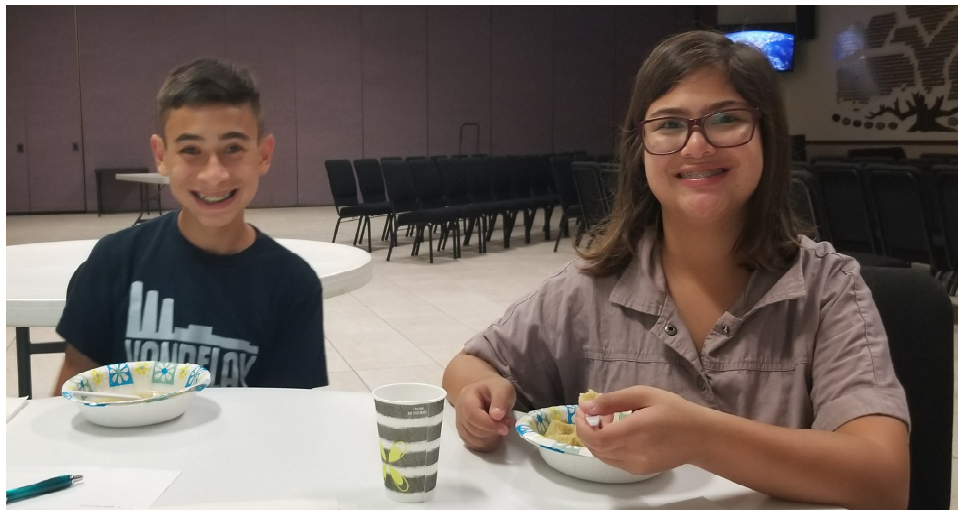
Making and eating Matzaball soup

L'ma-an tiz-k'ru va-a-si-tem et kol mitz-vo-tai, vi-h'yi-tem k'doh-shim lei-lo-hei-chem. A-ni Adonai eh-lo-hei-chem a-sher ho-tzei-ti et-chem mei-eh-retz mitz-ra-yim li-h'yoht la-chem lei-lo-him. A-ni Adonai eh-lo-hei-chem.