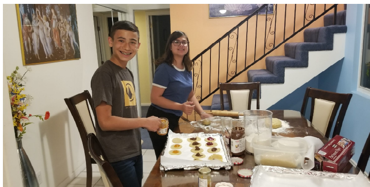
Making Hamantaschen for Purim

I like being Jewish because it is very interesting to be the minority to explain to the fellow non-Jews about the Jewish culture. I also like the fact that we have survived for century after century, attack after attack and yet here we are, alive, and practicing. I always feel a sense of pride explaining the aspects of a holiday to one of my friends, going to services, or even just eating Matzah. I am happy that we as a people have survived for this long and that I can explain and teach it to those who do not know. It can feel good to be different and in America being Jewish can be different in many ways.