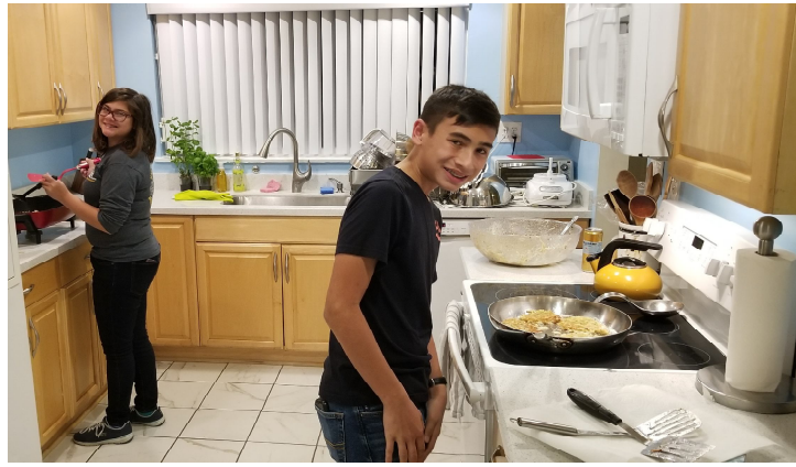
Making Latkes for Hanukkah